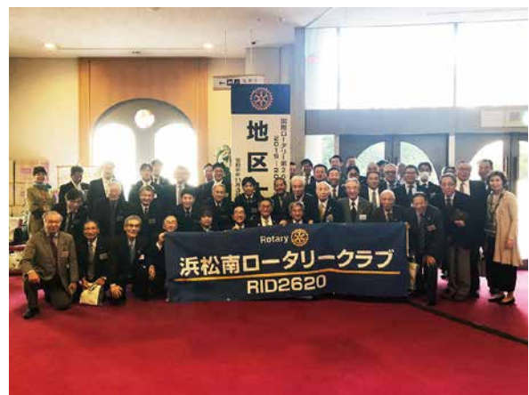
浜松南RC 参加メンバー